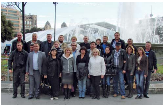
Учасники подорожі на Канарські острови

У компанії «Агробонус» впевнені у правильності обраного ними шляху, тож і надалі планують відповідати всім бажанням і потребам клієнтів, мотивувати їх на тривалу співпрацю.